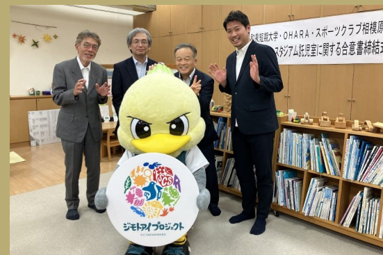
株式会社オハラ、学校法人和泉短期大学、SC相模原の3社によるスタジアム託児室に関する合意書の締結