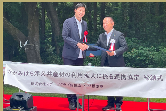
相模原市、SC相模原による「さがみはら津久井産材の利用拡大に係る連携協定」を締結