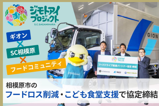
株式会社ギオン、NPO法人フードコミュニティ、SC相模原3社によるフードロス削減、こども食堂支援に関する協定締結